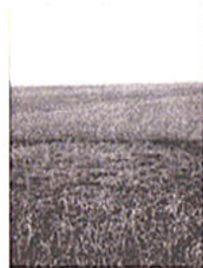
I cerchi nel grano a Bastida de' Dossi. Tracce di astronavi aliene atterrate in Oltrepò?

zamento dove non è presente, è addirittura cresciuta dell'erba. Dello strano episodio si è accorto sabato il proprietario del terreno che per primo si è incuriosito della stranezza dei segni presenti sulla sua proprietà, che restano tuttora distinguibili chiaramente costeggiando il campo. Il paragone che salta alla mente è quello con i più famosi "cerchi nel grano" anche se, oltre alla diversa coltura in oggetto in questo caso, è difficile stabilire punti di