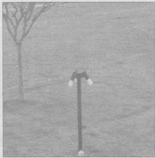
Il cerchio generato da una anomala crescita d'erba in un giardino privato

Chi volesse avere ulteriori informazioni e immagini può visitare il sito faenzashitsu.