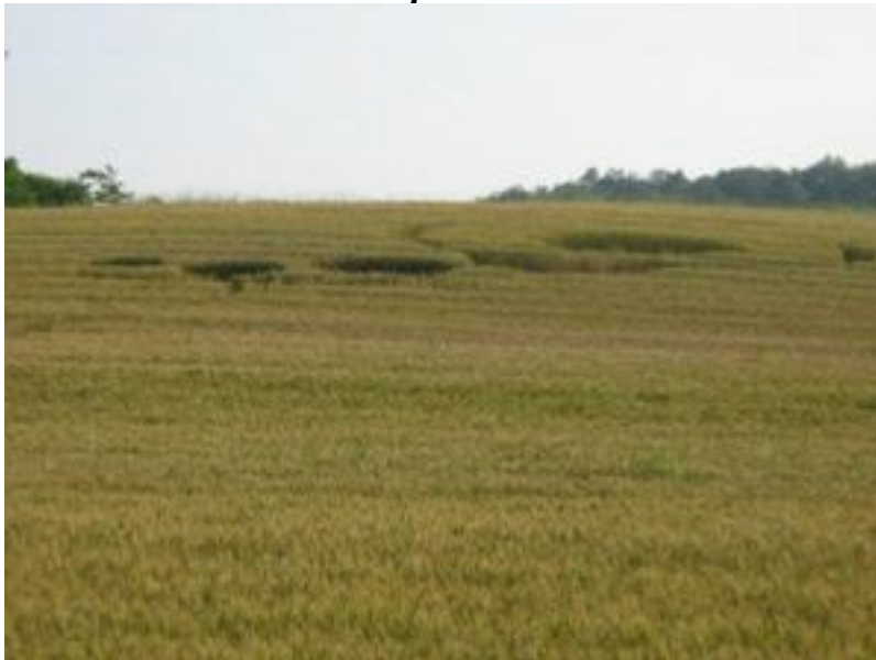
crop circle a Montaldo Roero

Montaldo Roero - Poche ore dopo la pubblicazione dell'articolo sui due nuovi avvistamenti di crop circle in provincia di Cuneo ecco giungere in redazione nuove conferme ed immagini da parte di un lettore: "mi chiamo Alessio Rizzitelli, da Trieste... Ho ricevuto da un'amica (abitante a