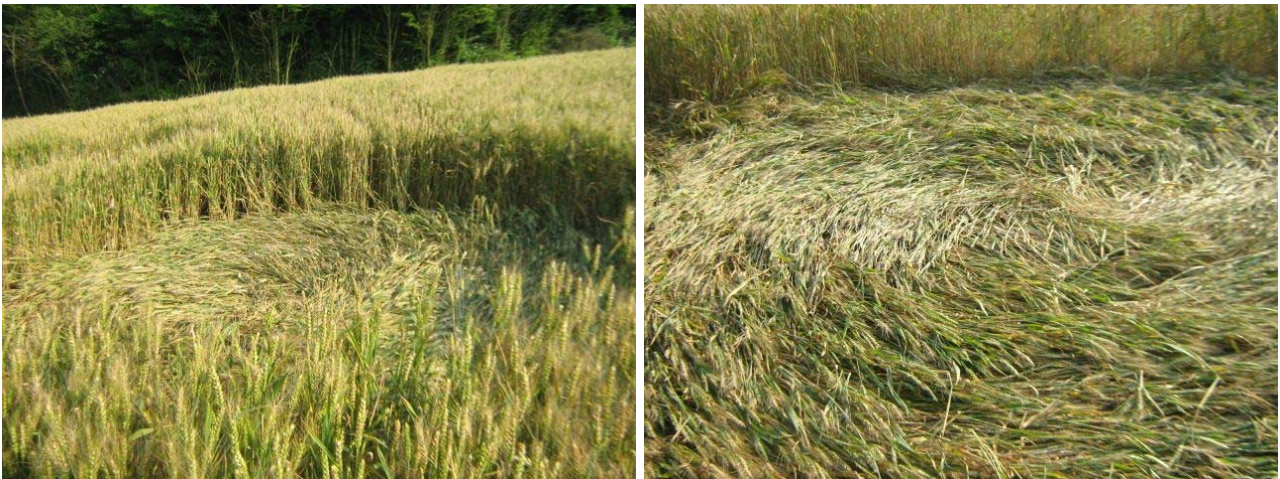
crop circle a Montaldo Roero.

Allego 3 foto. (Sono state scattate Sabato 21 Giugno 2008, di pomeriggio) In due foto si possono notare gli interni dei cerchi... con le spighe di grano piegate a formare una spirale. Nell'altra, i cerchi visti da qualche metro di distanza... Un cerchio sembra apparire "non finito" soltanto a causa della discesa del terreno sottostante.