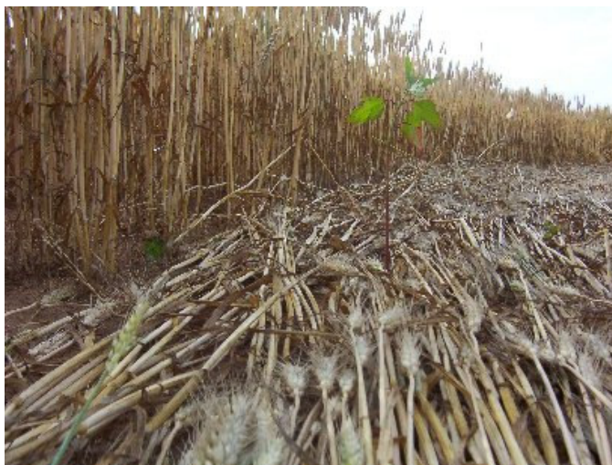
Una delle poche superstiti del cerchio del grano.

per la misurazione del raggio, si sia allentata inducendo allo sbaglio il circlemakers che stava appiattendendo le spighe di grano