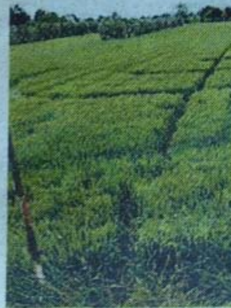
Il cerchio sul grano

Fermo Gli alieni sono tra noi e ci parlano. Sarebbe questo il significato del cerchio sul grano comparso ieri all'improvviso a Paludi. L'hanno scoperto alcuni appassionati di passeggiate a cavallo e da allora è stato un via via di gente. Una signora ha pure pianto. Chissà perché.