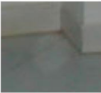
Orbs in hotel a Monastir