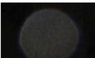
Orbs di Barcellona