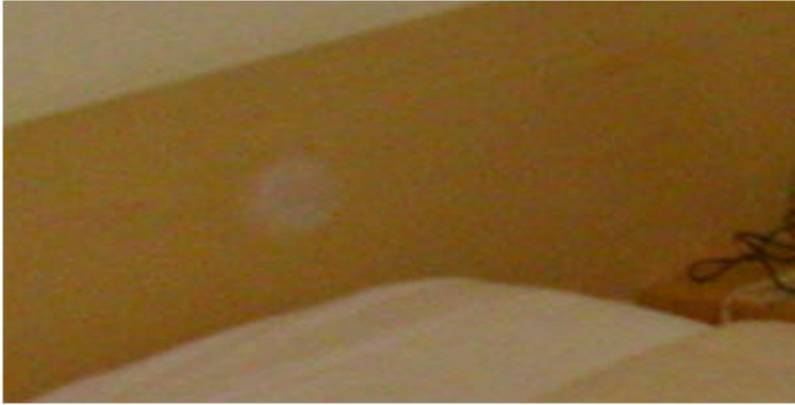
Orbs a S.Caterina

Le sfere di luce fotografate nei campi al buio sono SENZA OMBRA DI DUBBIO, delle limitazioni dell'accoppiata obiettivo-ccd o obiettivo-pellicola, è curioso vedere come il "disegno" di queste aberrazioni sia identico in molte foto fatte in condizioni simili, ovvero con flash in scarsa luminosità con apparecchi compatti o obiettivi molto spinti con un numero elevato di lenti: