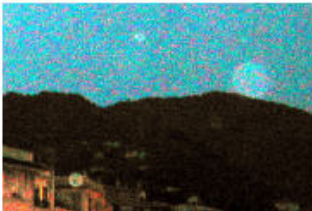
Immagine elaborata per mettere in risalto l'effetto Orbs (Rapallo)