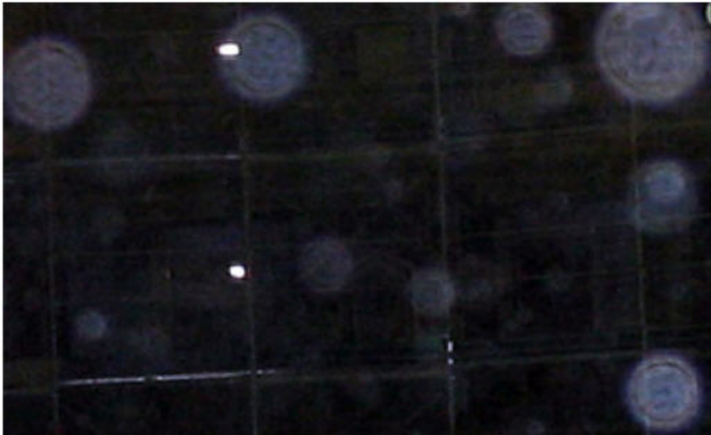
Orbs (Davvero tanti!) in un cantiere a Milano, foto realizzata con una macchina con ottica di medio-basso livello

Ho sempre avuto apparecchi abbastanza buoni che raramente mi hanno dato tale problema. In questa sede allego solo il particolare in questione perché nelle foto vi sono delle persone. Tale distorsione è praticamente assente in tutte le foto che ho fatto con apparecchiatura di qualità (Canon G5).